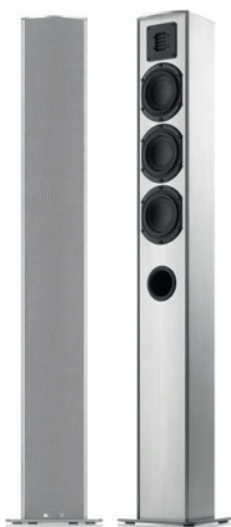
TMicro 60 AMT