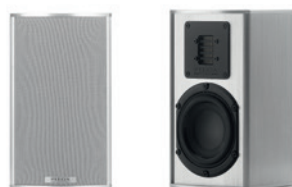
TMicro 40 AMT