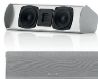
TMicro Center AMT