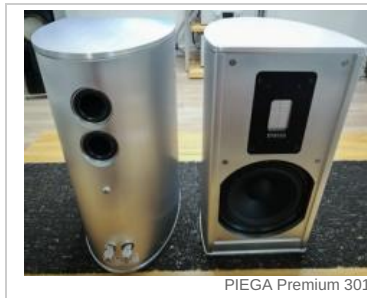
PIEGA Premium 301

הגודל קובע בהחלט. אבל כשמחליטים להתעקש ממש, ולתכנן משהו קטן שיעשה את זה בגודל, הרמקול הזה עשוי להיות זה שישבור את המיתוס. האם יצליח? הכנסו וגלו