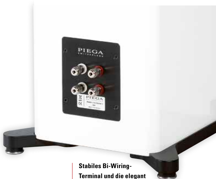
Stabiles Bi-Wiring-Terminal und die elegant eingefügten Ausleger