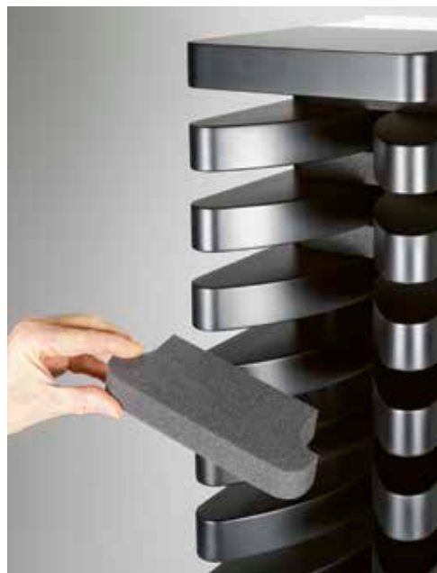
Ein Dutzend dieser Schaumstoffdämpfer lassen eine feinstufige Veränderung der Dipolcharakteristik zu.

Damit der Besonderheiten aber längst nicht genug, denn die MLS 3 ist wie ihre beiden größeren Brüder im Mittel-/Hochtonbereich als Dipol-Lautsprecher konzipiert, ein Konzept, bei dem der von den Chassis erzeugte Schall sowohl nach vorne als auch nach hinten abgestrahlt wird. Eine Anwendung, die einem Bändchen mit von Hause aus beidseitiger Abstrahlung durchaus entgegenkommt, muss doch kein rückwärtiger Schallanteil durch Dämpfungsmaßnahmen mühselig vernichtet werden.