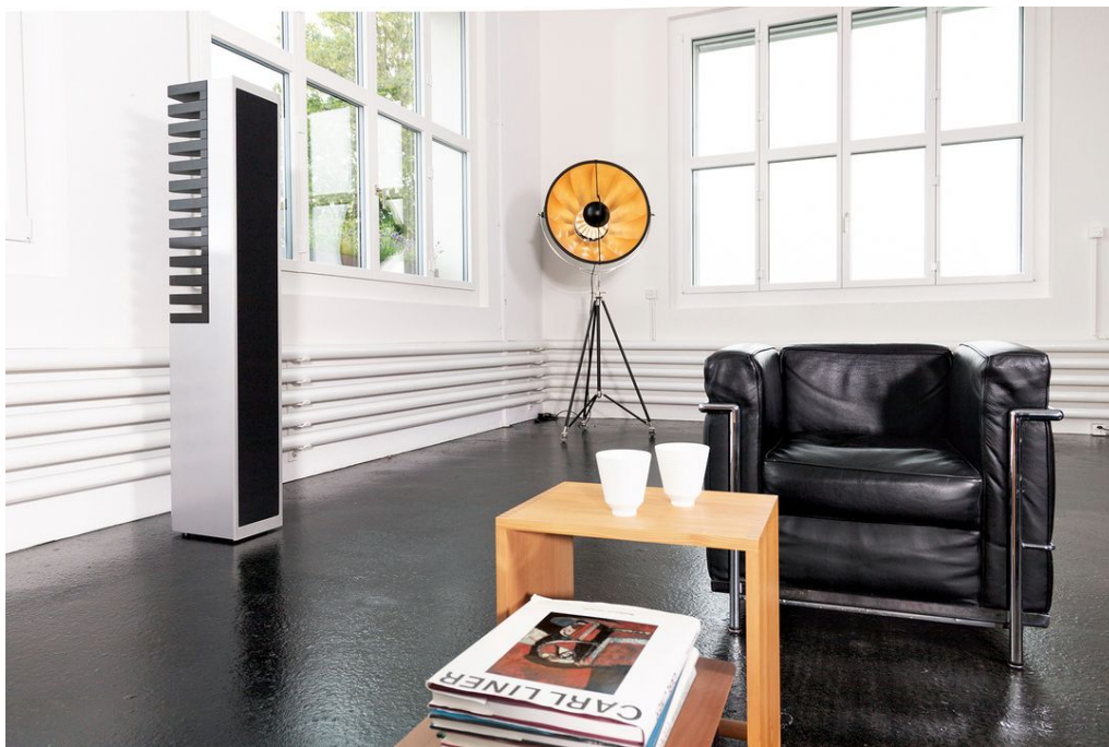
Meisterhaft. Die Lautsprecher aus der Master Line Source Serie bilden das Flagship von PIEGA.

Das ist zweifellos die Premium Wireless Serie. Das Produkt ist sicherlich deshalb so beliebt, weil nun zum ersten Mal die kabellose Wiedergabe mit einer High-Fidelity-Auflösung kombiniert werden kann. Die Aktiv-Lautsprecher werden über eine digitale Funkverbindung angesteuert, spielen die über Bluetooth gestreamte Musik vom Smartphone und können in ein Multiroom-System integriert werden. Es kombiniert also eine einfache Bedienung mit höchster Musikqualität.